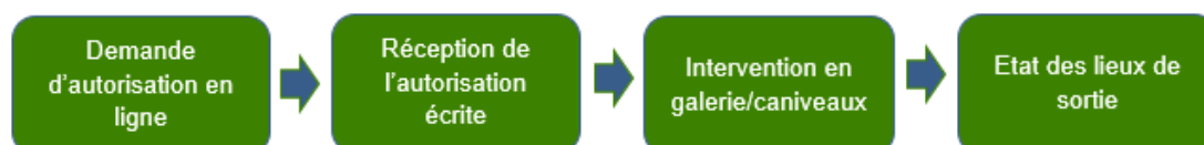
Afbeelding 1 Schema van de fasen van de procedure

De procedure bestaat uit de volgende fasen: