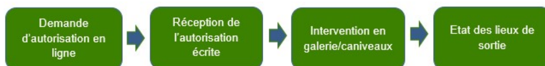
Figure 1 Schématisation des étapes de la procédure

Elle est composée des étapes suivantes :